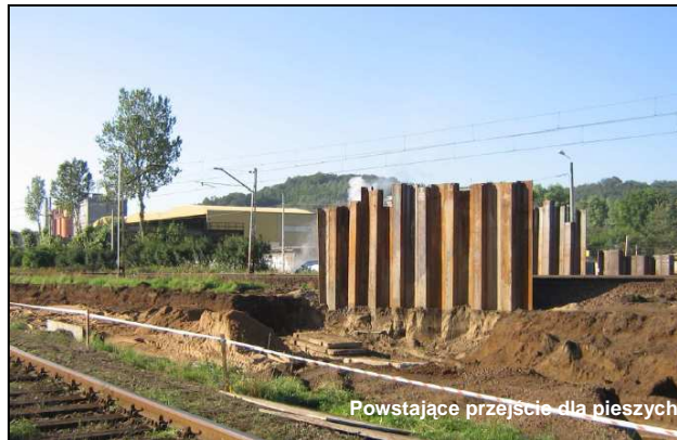
Powstające przejście dla pieszych