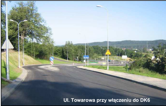
Ul. Towarowa przy włączeniu do DK6