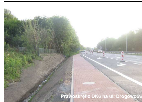
Prawoskręt z DK6 na ul. Drogowców