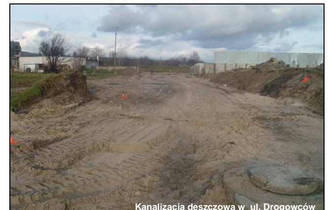
Kanalizacja deszczowa w ul. Drogowców