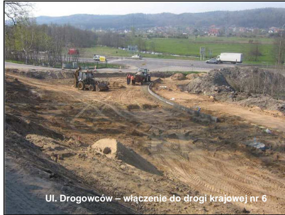
Ul. Drogowców – włączenie do drogi krajowej nr 6