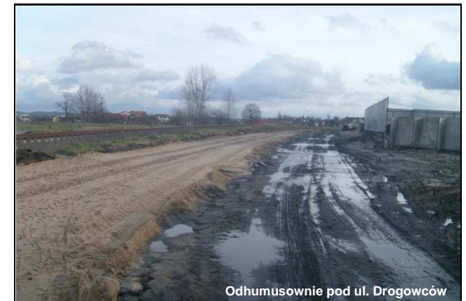
Odhumusownie pod ul. Drogowców