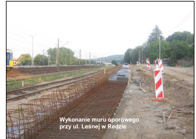
Wykonanie muru oporowego przy ul. Leśnej w Redzie