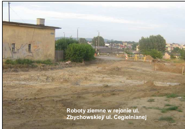
Roboty ziemne w rejonie ul. Zbychowskiej/ ul. Ceglarnianej