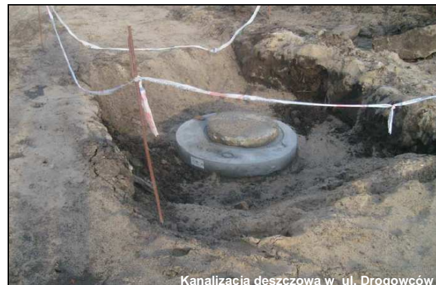
Kanalizacja deszczowa w ul. Drogowców