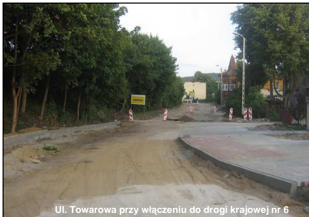
Ul. Towarowa przy włączeniu do drogi krajowej nr 6