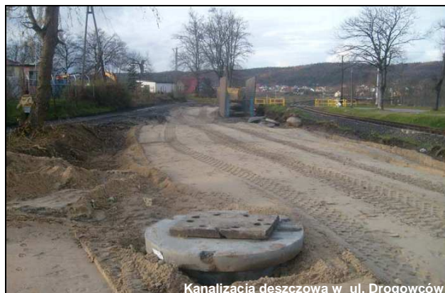
Kanalizacja deszczowa w ul. Drogowców