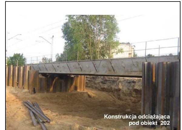
Konstrukcja odciążająca pod obiekt 202