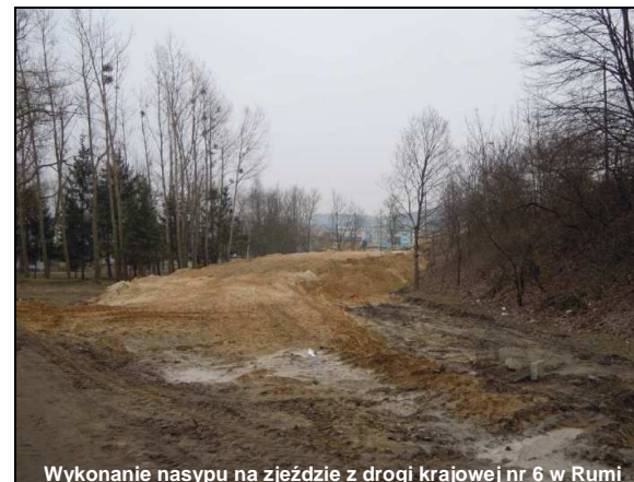
Wykonanie nasypu na zjeździe z drogi krajowej nr 6 w Rumi