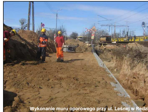
Wykonanie muru oporowego przy ul. Leśnej w Redzie