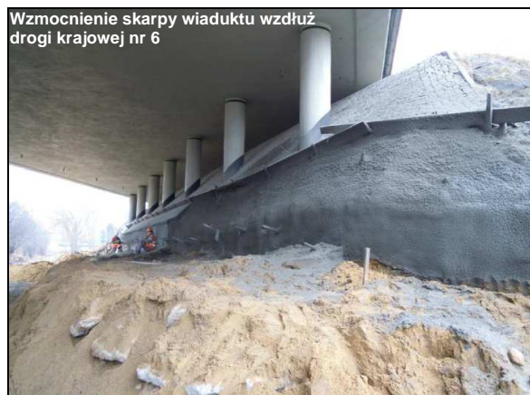
Wzmocnienie skarpy wiaduktu wzdłuż drogi krajowej nr 6