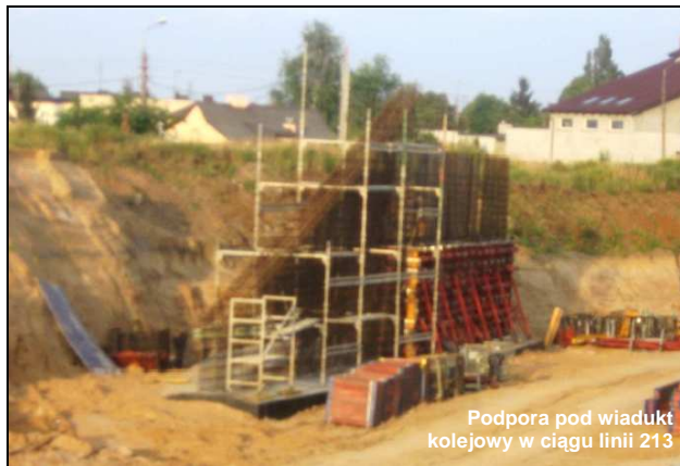
Podpora pod wiadukt kolejowy w ciągu linii 213