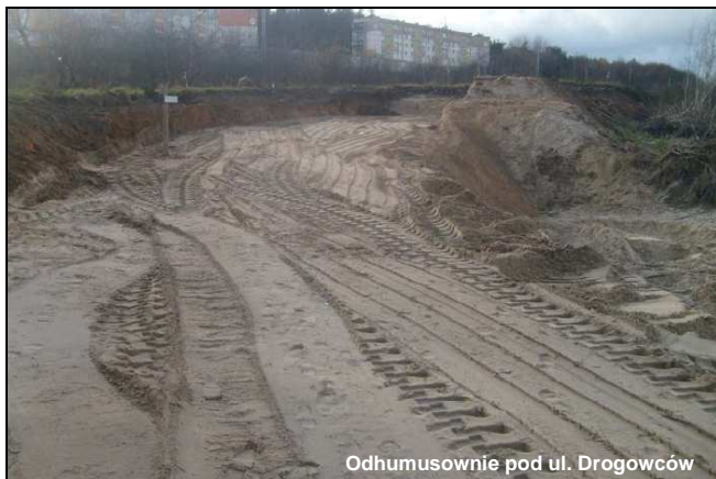
Odhumusownie pod ul. Drogowców