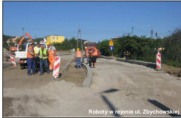
Roboty w rejonie ul. Zbychowskiej