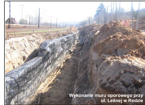
Wykonanie muru oporowego przy ul. Leśnej w Redzie