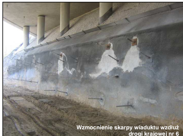
Wzmocnienie skarpy wiaduktu wzdłuż drogi krajowej nr 6