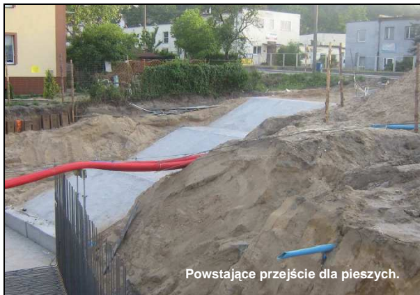
Powstające przejście dla pieszych.