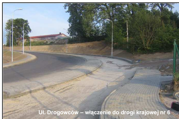
Ul. Drogowców – włączenie do drogi krajowej nr 6