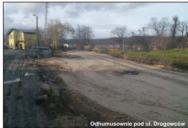
Odhumusownie pod ul. Drogowców