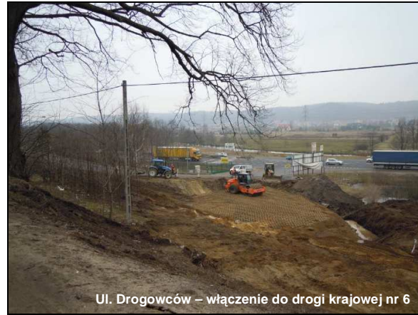
Ul. Drogowców – włączenie do drogi krajowej nr 6