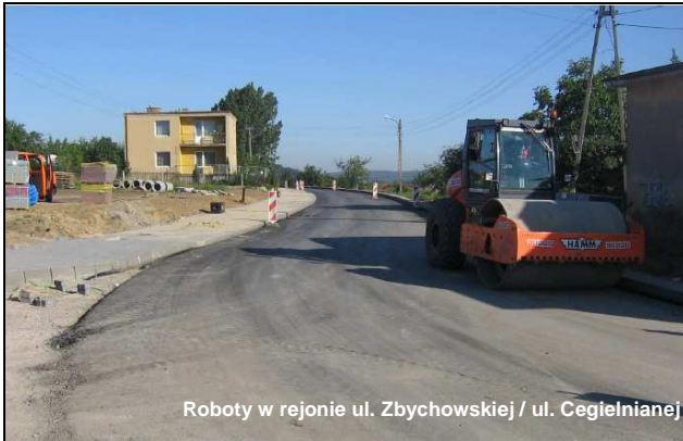
Roboty w rejonie ul. Zbychowskiej / ul. Cegielnianej