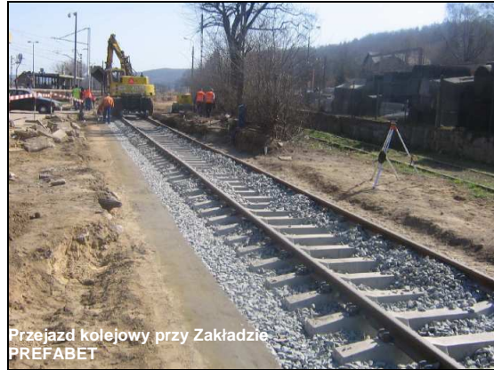
Przejazd kolejowy przy Zakładzie PREFABET