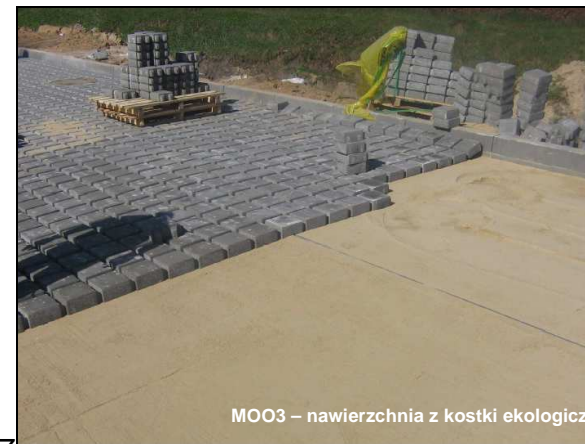
MOO3 – nawierzchnia z kostki ekologicznej