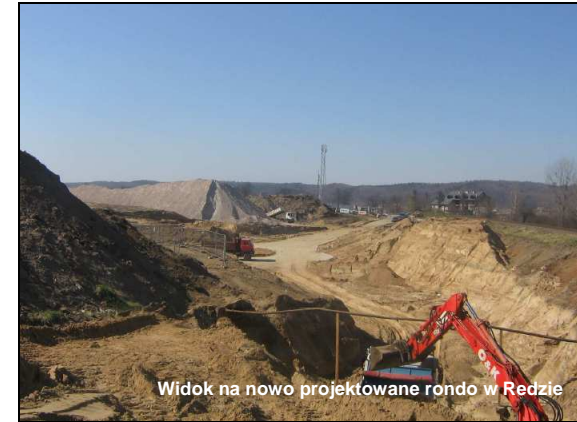
Widok na nowo projektowane rondo w Redzie