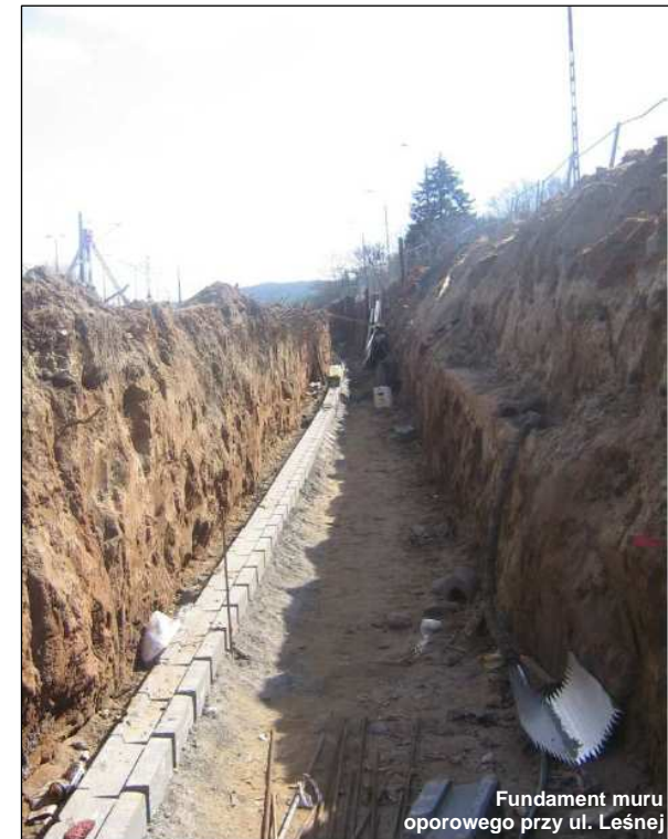
Fundament muru oporowego przy ul. Leśnej