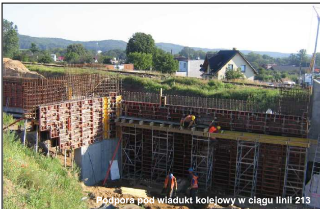
Podpora pod wiadukt kolejowy w ciągu linii 213